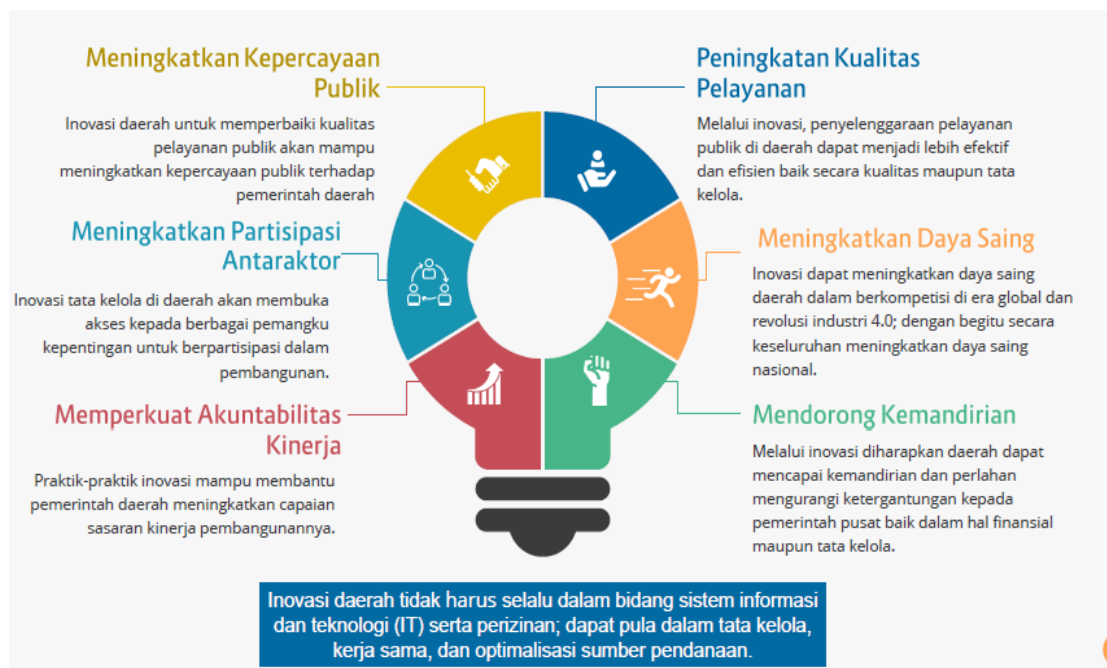
Gambar 1. Urgensi Inovasi Dalam Kerangka Desentralisasi (Bappenas, 2018)